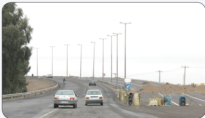
عملیات احداث پل شهدای غواص