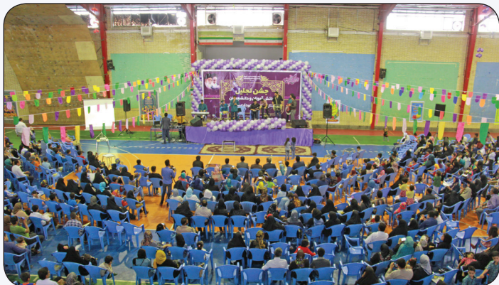
جشن بزرگ کارکنان شهرداری