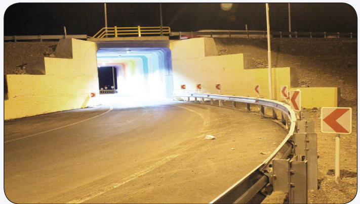
احداث زیرگذر پل شهید گرم فتحی زاده