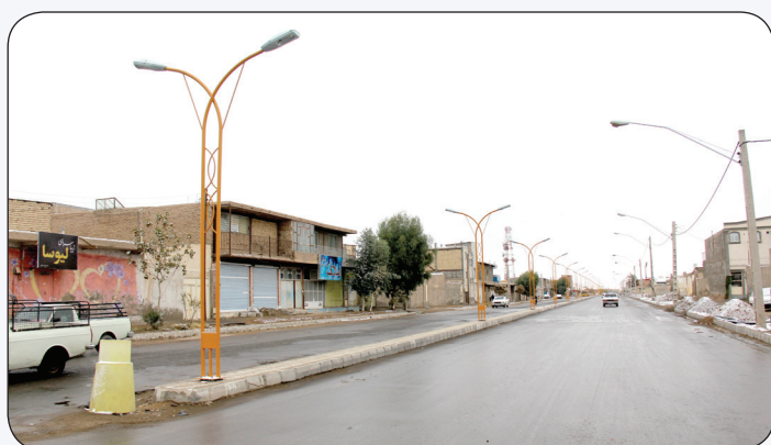
تملک و تعریض خیابان امین عباسی