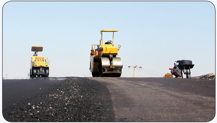
نمایی از آسفالت خیابان‌ها