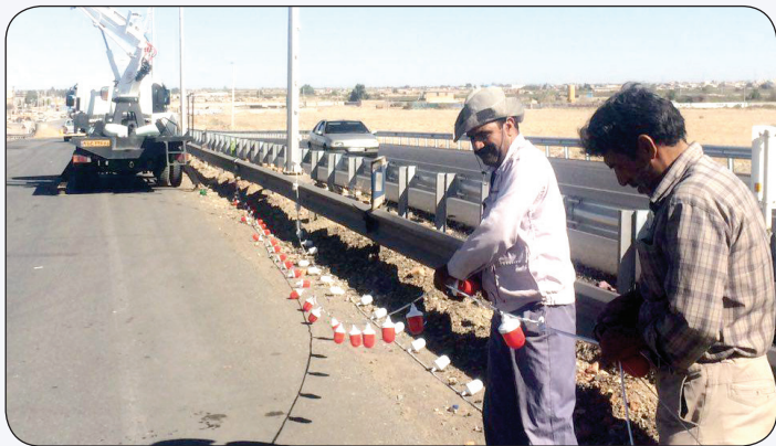
چراغانی پل شهید گرم فتحی زاده