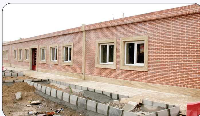
عملیات احداث مجتمع سازمان های شهرداری