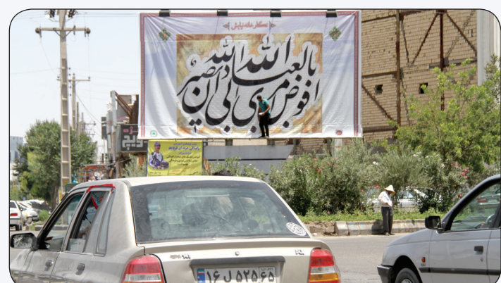
اجرای طرح نگارخانه نیایش در سطح شهر