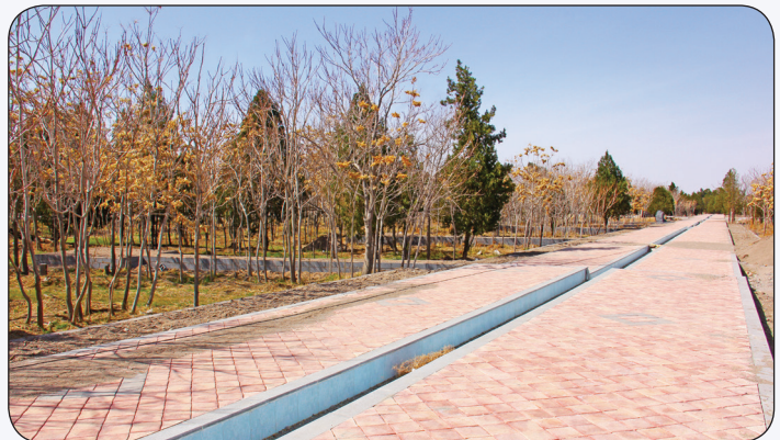
عملیات احداث پروژه باغ ایرانی