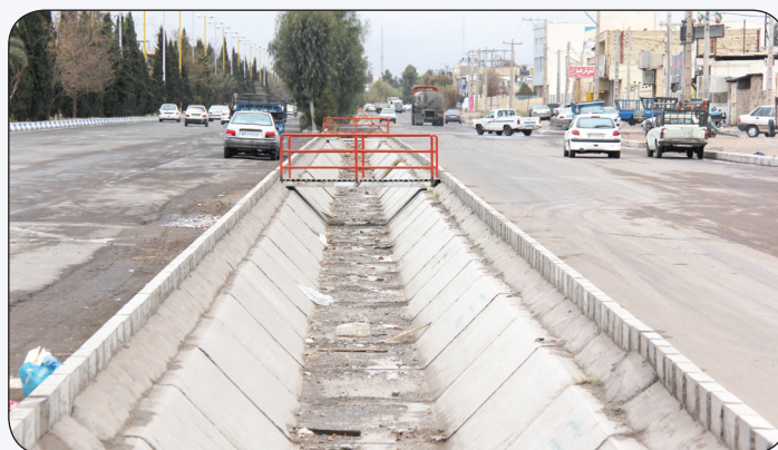
عملیات احداث پروژه هدایت آب های سطحی