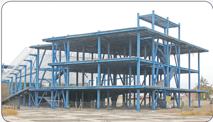
عملیات احداث سالن همایش های شهرداری