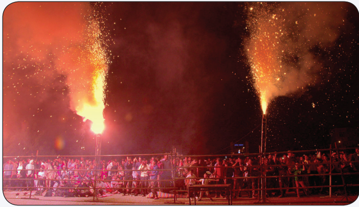
برگزاری جشن شهروند (نیمه شعبان)