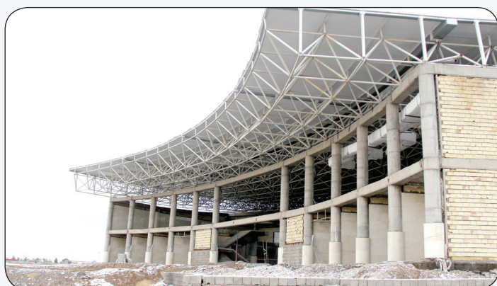
اجرای پروژه پایانه مسافربری