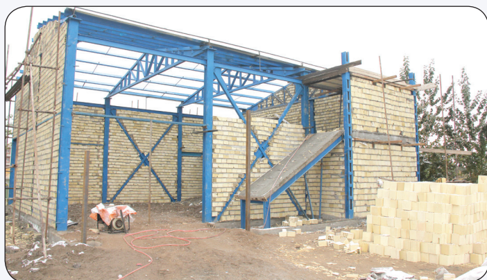
عملیات احداث پلاتو نمایش