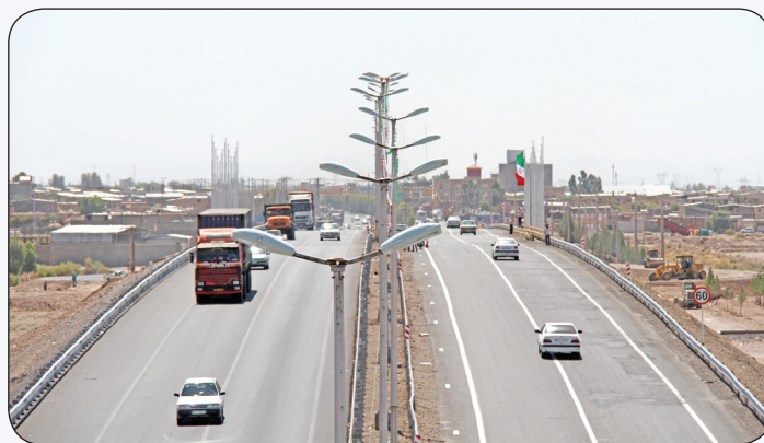
احداث پل شهید کرم فتحی زاده