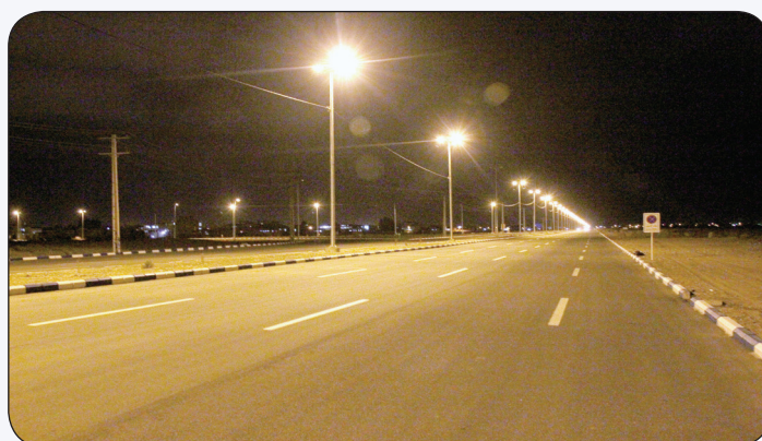
احداث بلوار قائم