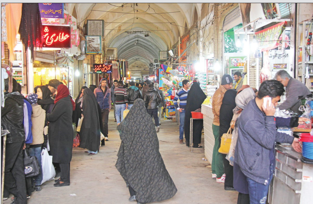
شهردار سیرجان خبر داد:

به مبلغ بیش از ۲۱ میلیون ۶۰۰ هزار ریال قبل از صدور رای پرداخت شد.